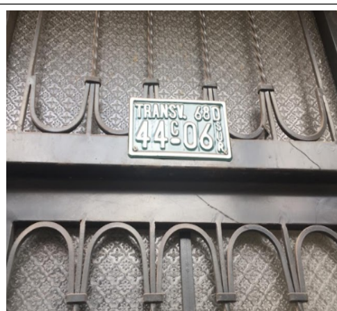
FOTOGRAFÍA N°. 2 NOMENCLATURA DEL PREDIO