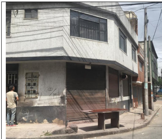
FOTOGRAFÍA N°. 1 FACHADA DEL PREDIO